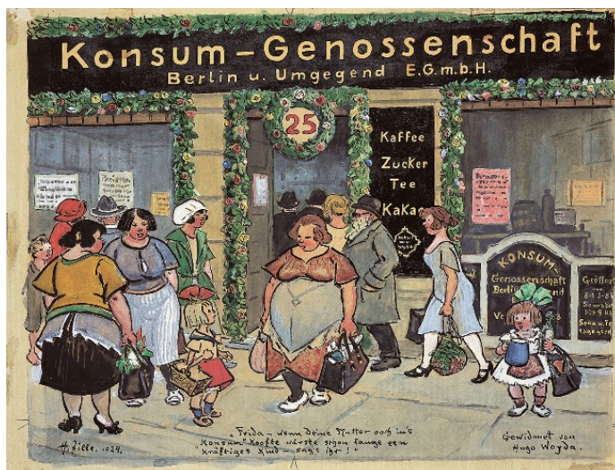
Obr. 1 a 2 : Konsum – Genossenschaft